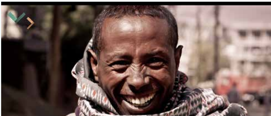
Den ene af Promissios nye videoer giver en oplevelse af Promissios arbejde og har til hensigt at give seeren lyst til at være en del af Promissios arbejde.

Den ene video giver en konkret invitation til at blive udsendt af Promissio, mens den anden video er mere fortællende, så seeren får en oplevelse af Promissios arbejde og bliver inviteret til at blive en del af det.