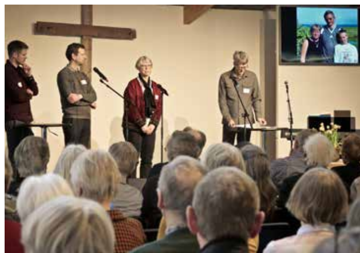
Gennemgangen af Promissios historie bød blandt andet på indslag fra tidligere missionærbørn, der fortalte om deres tid på den anden side af kloden.